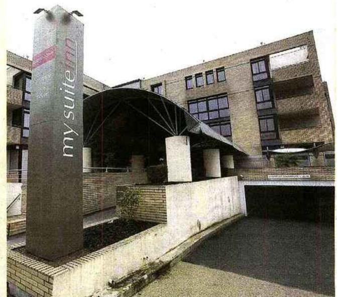
LOGNES (SEINE-ET-MARNE), HIER. Apollonia proposait aux clients d'investir dans des projets immobiliers comme celui-ci en empruntant de l'argent aux banques. En contrepartie, la société garantissait que les loyers couvriraient le remboursement du prêt.